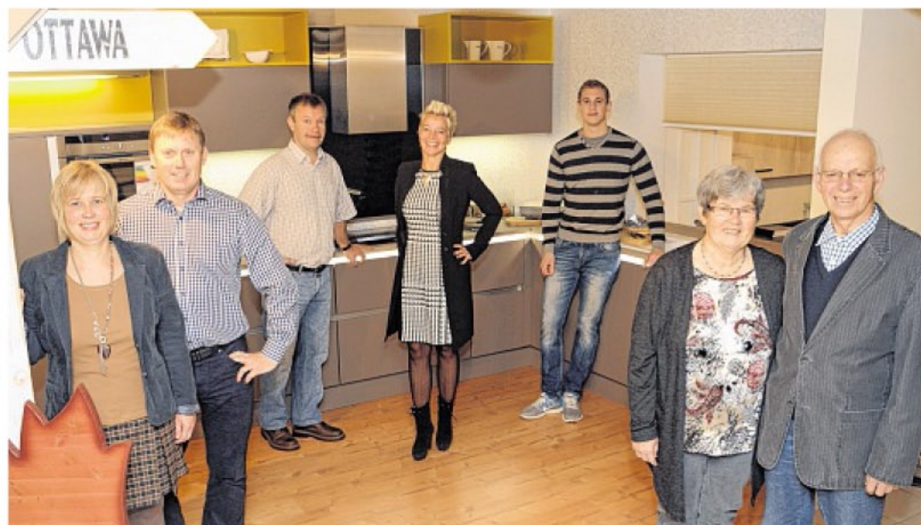
Super ausgestattete Küchen zu Top-Preisen vom Möbel Hansen-Team im Jubiläumsjahr 2014.